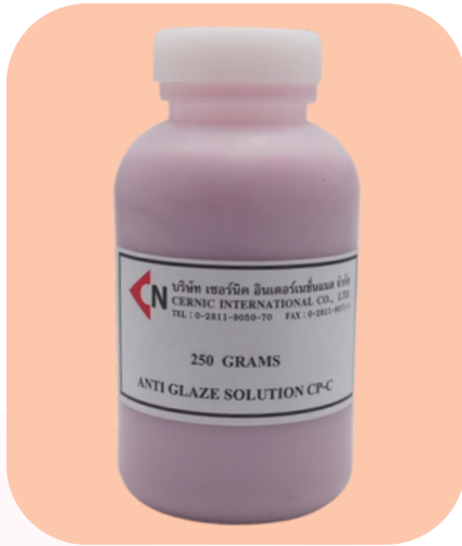
ภาพสินค้า