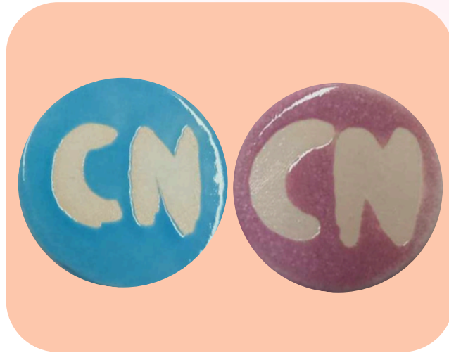
ตัวอย่างเผา 1200 C